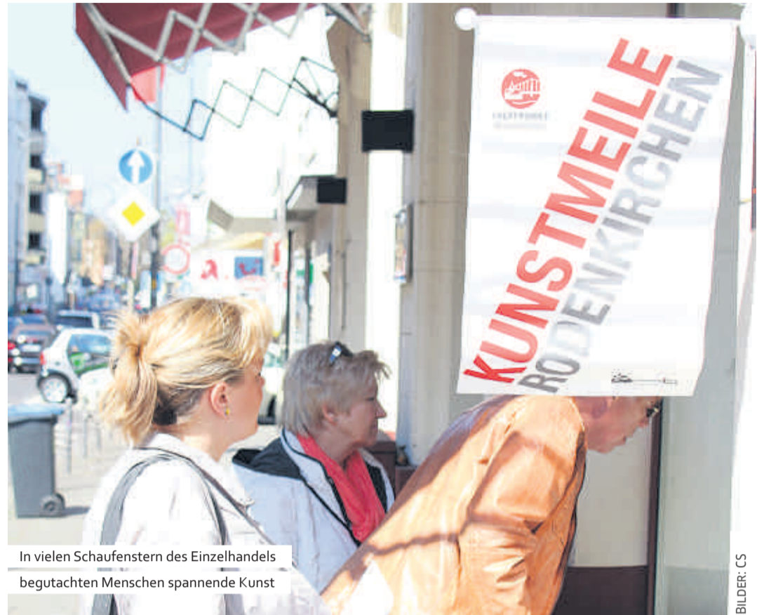
In vielen Schaufenstern des Einzelhandels begutachten Menschen spannende Kunst